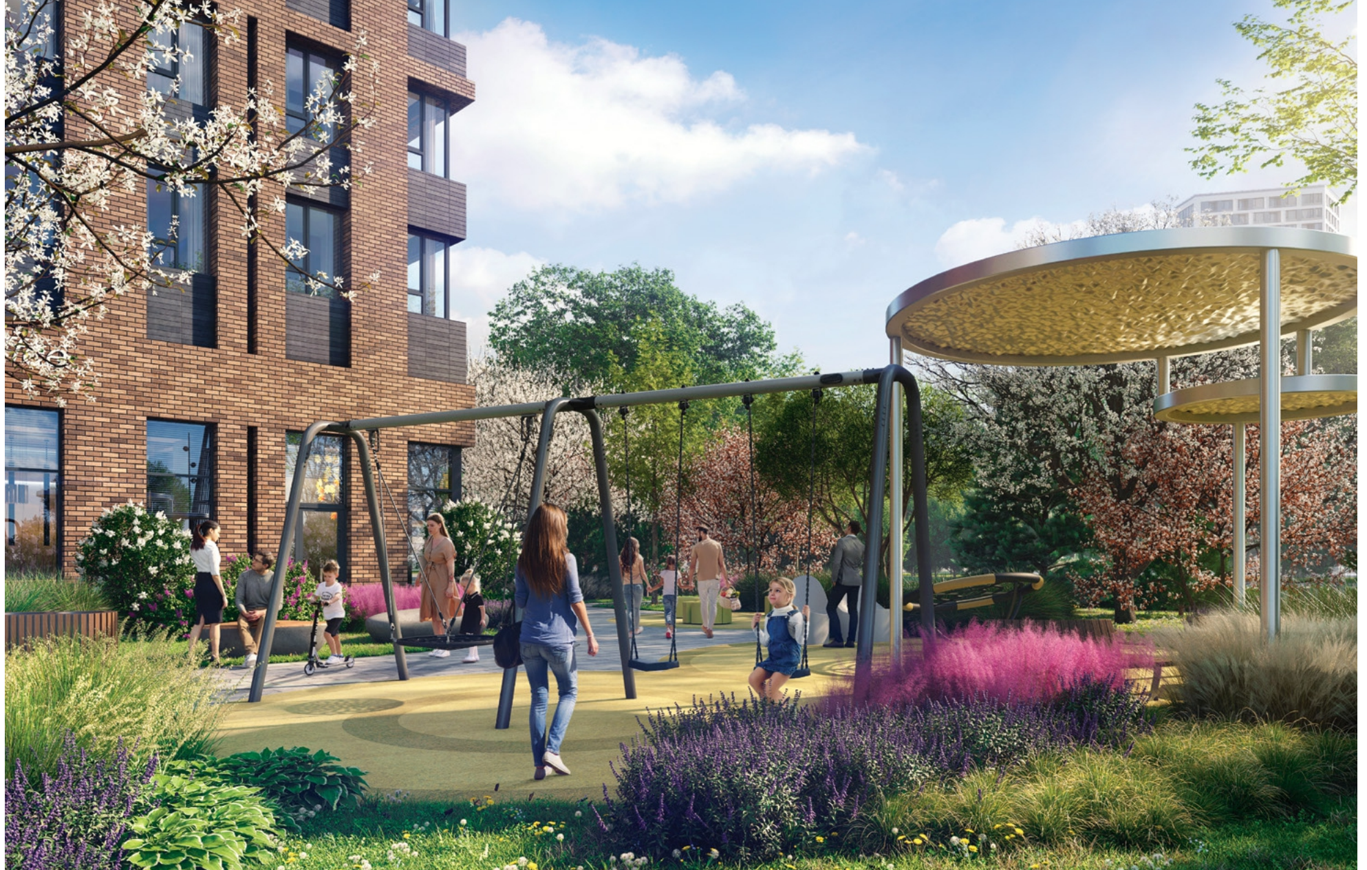
ВИЗУАЛИЗАЦИИ ПРЕДВАРИТЕЛЬНЫЕ, ВОЗМОЖНЫ ИЗМЕНЕНИЯ