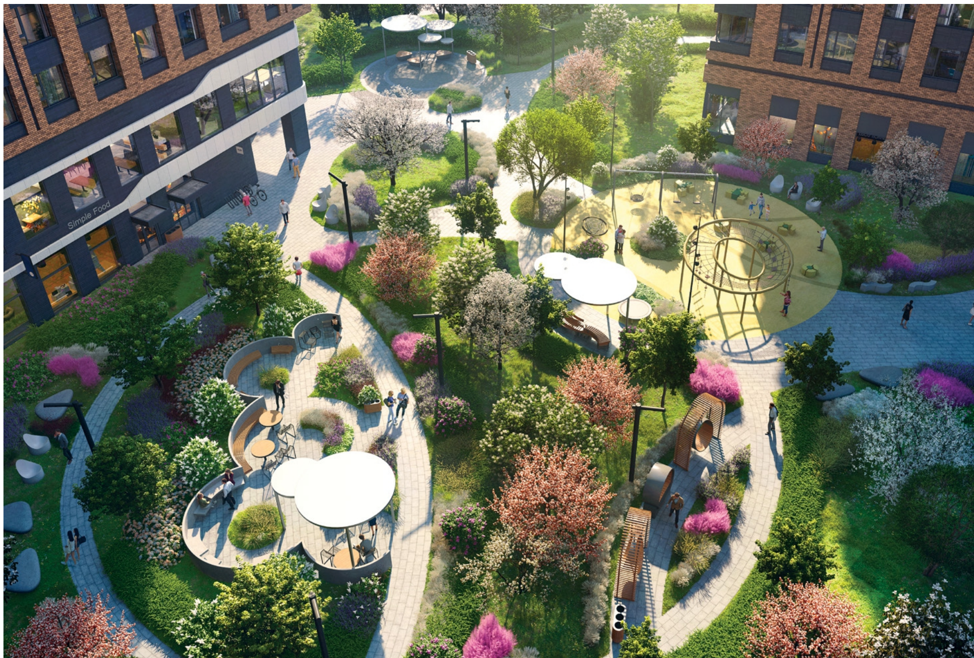
ВИЗУАЛИЗАЦИИ ПРЕДВАРИТЕЛЬНЫЕ, ВОЗМОЖНЫ ИЗМЕНЕНИЯ